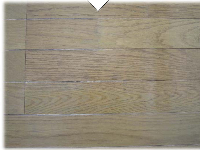
ひどい剥がれもこの通り!! 貼替工事をしなくて済みました!!

「もったいない」の気持ちからリフォーム工事を提案します。取り替えずに直すという、補修のスペシャリストとして立場から、取り替え一辺倒のリフォーム工事を根底から見直し、リペア(補修)を可能な限り取り入れたリフォーム工事を提案します。