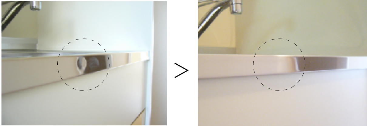
ステンレスシンク凹み